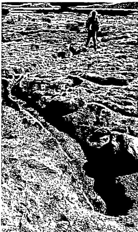
FOTO 2. Descarga del efluente tratado a un curso de agua superficial.