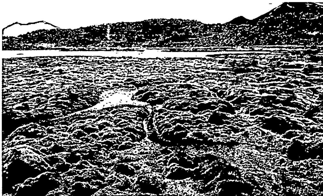
FOTO 3. Curso de agua superficial en donde se descarga el efluente de la planta de tratamiento del poblado de Parinacota.